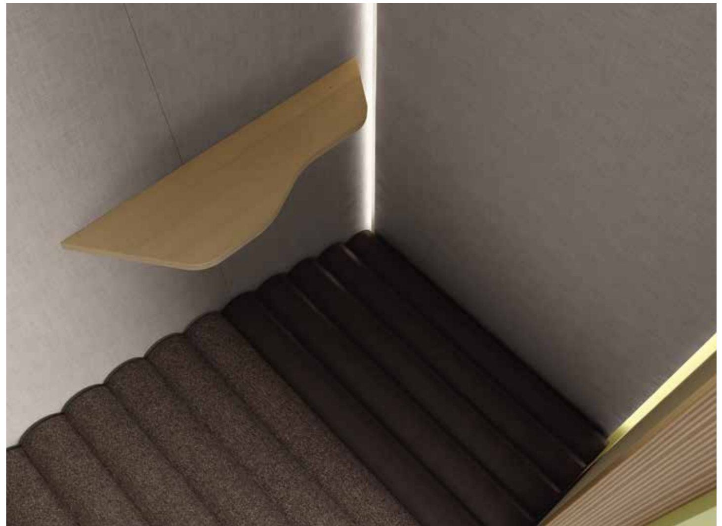
Ordnung muss sein. Das formschöne Tablar bietet eine praktische Ablage für Portemonnaie, Schlüssel oder Mobile Phone.