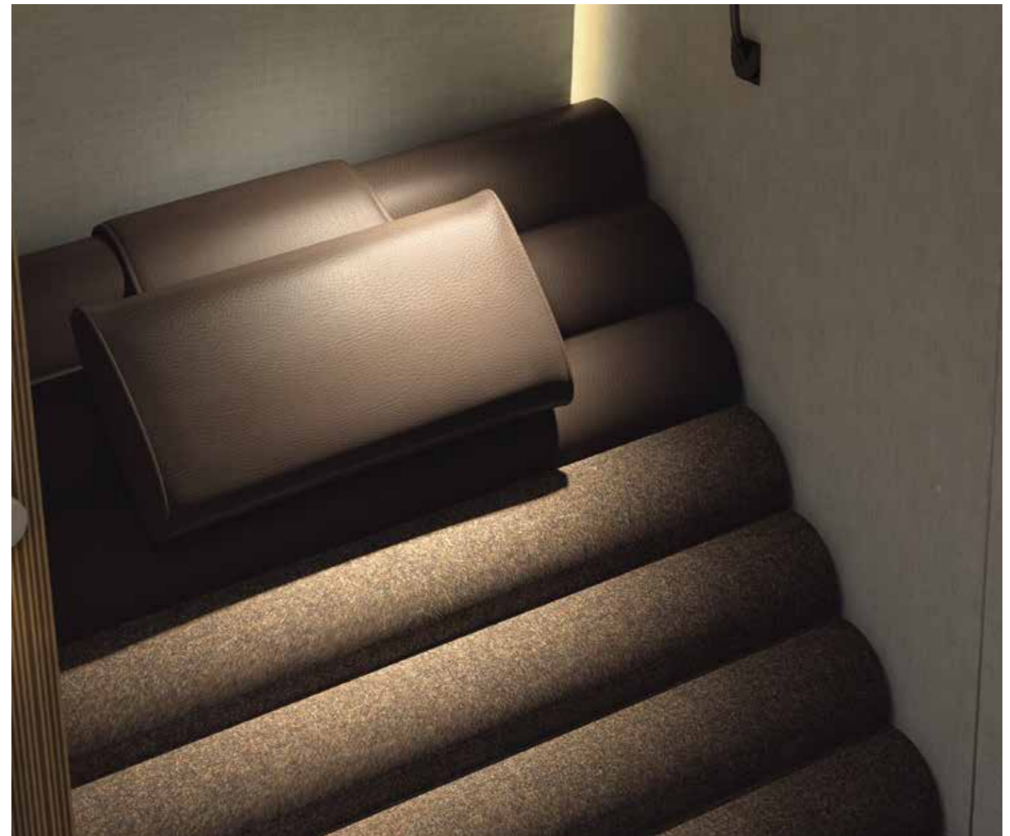
Das ergonomisch geformte, verstellbare Nackenkissen aus Kunstleder ist eine optimale Kopfstütze. Für den erholsamen Kurzschlaf.