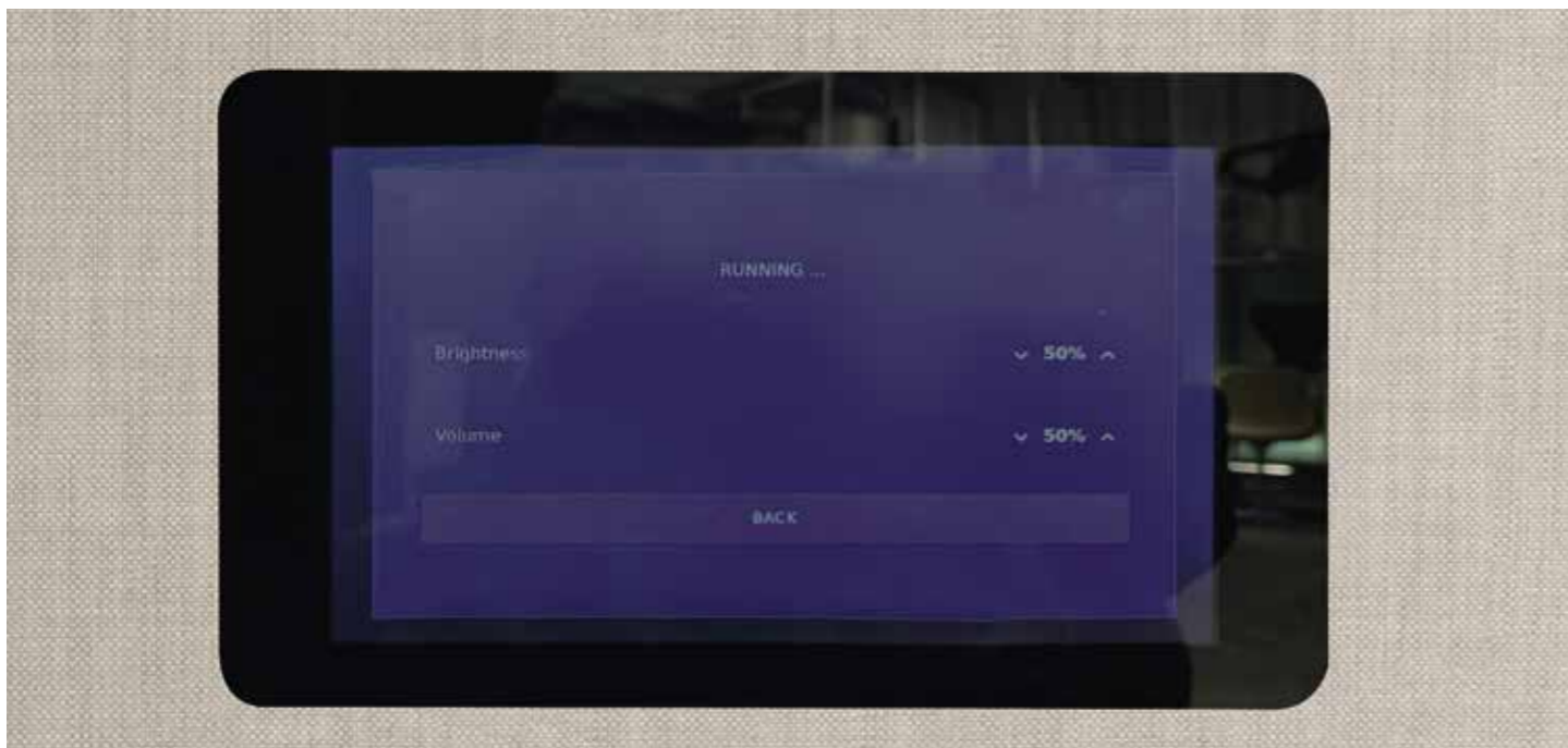
Mittels Bluetooth verbindet man das Mobile Phone mit dem unter der Stoffverkleidung nicht sichtbar eingebauten Lautsprecher oder man bedient sich seiner eigenen Kopfhörer. Lieblingsmusik an und einfach mal abtauchen!