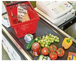
Der Caritas-Markt deckt den pdtäglichen Bedarf – auch bei knappem Budget.

schiedene Sorten) und diverse Guetsli für um die zwei Franken, grosse Chlaussäckli für 3.60 Franken, sowie Pfannen und Geschirr zu unschlagbaren Preisen.