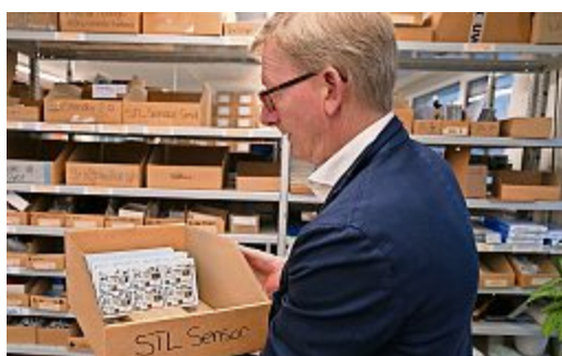
Hightech-Komponenten kommen zum Einsatz. gs